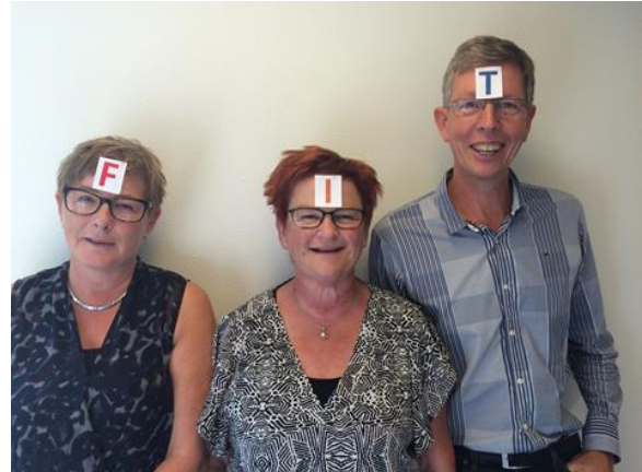
"FIT på hjernen"

Der tilbydes gruppebehandlingsforløbene "Cool Kids" til børn med angstlidelser i alderen 8 til 12 år og "Chilled Kids" i alderen 13 til 18 år. I behandlingstilbuddet deltager forældrene sammen med deres børn. Vi har i 2017 erfaret at flere børn end før har angstsymptomer, og derfor har personalet gennemført en kompetenceudvikling på angstområdet, så vi kan imødekomme den forventede efterspørgsel på angstbehandling.